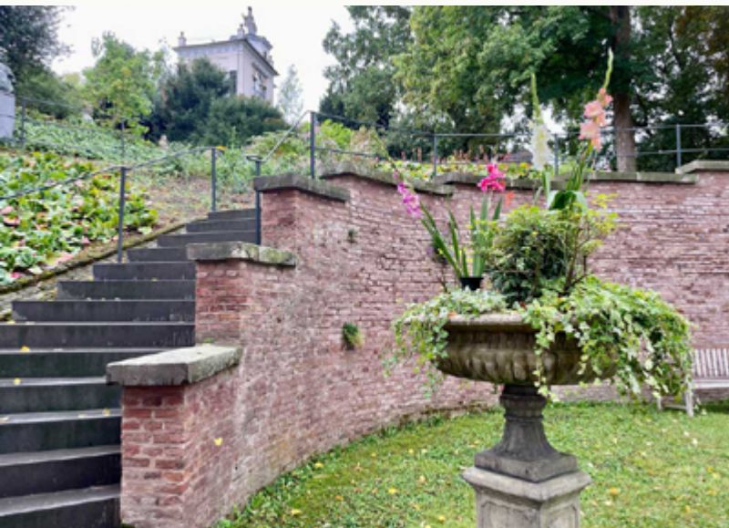
Abb.: Terrassengarten hinter dem BCKH, Foto: Helga Diekhöfer

Freuen Sie sich auf einen Besuch im B.C. Koekkoek-Haus am Samstag, den 13. Juni 2026.