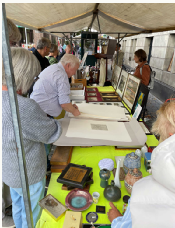
Abb.: Flohmarkt am 13. September 2025

Am Samstag, den 27. Juni 2026, von 10:00 Uhr bis 16:00 Uhr ist der Freundeskreis Klever Museen auf dem Schnäppchen- & Flohmarkt in der Kavarinerstraße vertreten. Als besondere Aktion gibt es diesmal den Sonderverkauf einer Mappe mit Druckgrafik von Ernst Schönzeler aus unserem Antiquariat. Ein Besuch des Marktes lohnt sich immer.