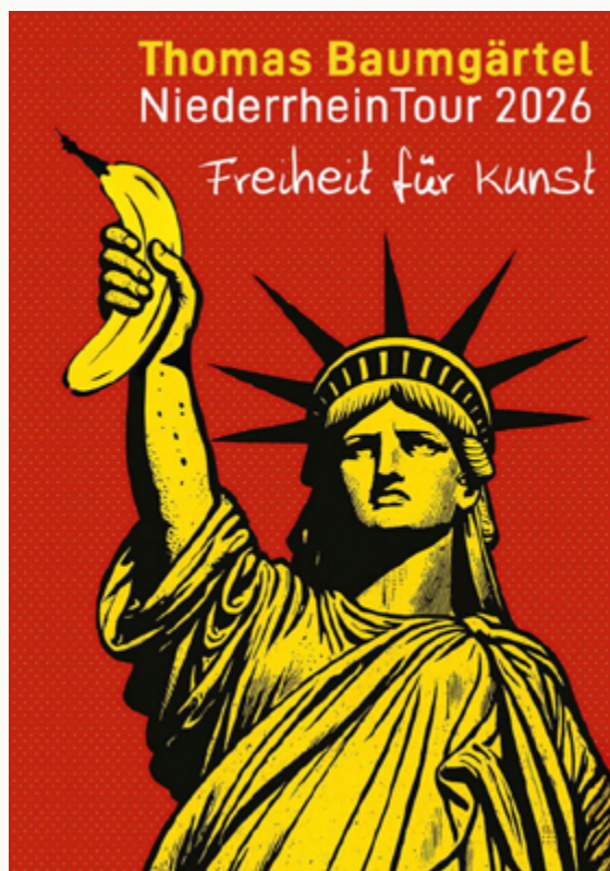
Abb.: Plakat zur Ausstellung Thomas Baumgärtel, 2026